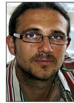
Der Autor berichtet regelmäßig für unsere Zeitung aus China.

Doch wie kann es überhaupt sein, dass ausschließlich die Krise von Tibet eine solch geballte Form des Protestes lanciert? Hat es auch damit zu tun, dass es schon lange Zeit war, den Chinesen all das zurückzuzahlen, was sich an Verärgerung angestaut hat? Schließlich sind die Chinesen in eine Rolle geschlüpft, an die sich der Westen erst noch gewöhnen muss. Das Reich der Mitte ist inzwischen in der Lage, seinerseits Konsequenzen für bilaterale Beziehungen auszusprechen, wenn ihm dies oder jenes im Verhalten der Mitspieler auf politischem Parkett nicht passt. Von dieser Kraft machen die Chinesen reichlich Gebrauch. Das muss man erst mal schlucken. Und irgendwie tut ein Ventil doch dann ganz gut, oder?