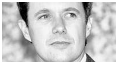
Kronprinz Frederik muss richtig reden lernen.

KOPENHAGEN. Dänemarks Kronprinz Frederik muss mit 39 Jahren „richtig reden lernen“. Das verlangen die Spitzen der heimischen Sportverbände, wenn der Thronfolger und Sohn von Königin Margrethe II. (67) wie geplant den Platz seines Landes im Internationalen Olympischen Komitee (IOC) einnehmen soll. „Ekstra Bladet“ schrieb gestern: „Laut Internetseite des Königshauses beherrscht der Kronprinz Dänisch, Englisch, Französisch und Deutsch. Was fehlt: Dass er meist Kauderwelsch von sich gibt.“