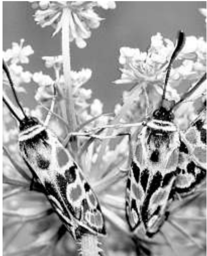
Kraier Widderchen auf einer Blüten-dolde

BREMEN. Die ARD hat wichtige Personalentscheidungen getroffen. So wurden die Verträge für die Kommentatoren Gerhard Delling und Günther Netzer verlängert. Trotz des Ausstiegs der Telekom aus dem Radsport und Doping-Enthüllungen will die ARD auch 2008 von der Tour de France berichten. (dpa)