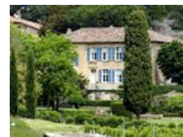
Jolie-Pitt finden Traumhaus in der Provence