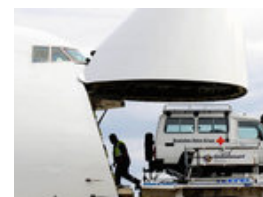
Mobiles Krankenhaus behandelt Opfer