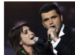
Grand Prix - Die Finalisten in der FR-Wertung