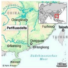
Von Marcel Grzanna

Kaum eine chinesische Stadt hat die Krise so hart getroffen wie Dongguan. Tausende Betriebe gingen pleite, Millionen verloren ihre Jobs. Jetzt mehren sich die Zeichen eines Aufschwungs und die Hoffnung auf Arbeit kehrt zurück. Doch es ist nicht mehr wie früher