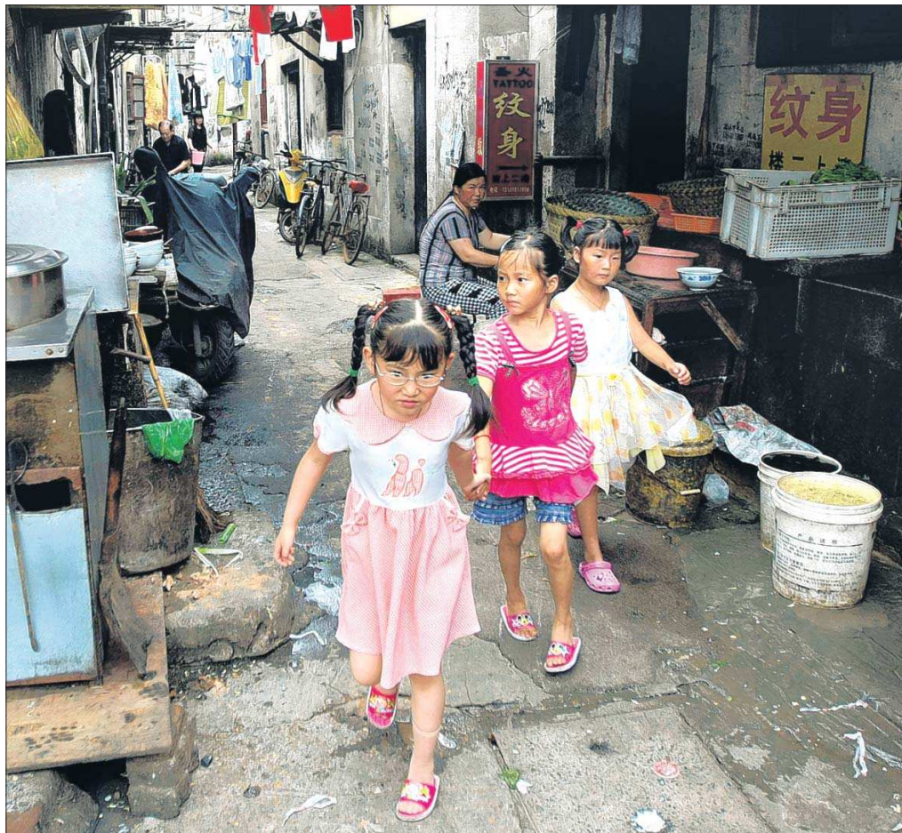
Nicht ungefährlich ist es für Kinder in China, wenn sie unbeaufsichtigt durch Gassen laufen. Der Kinderhandel blüht, die Adoption von entführten Kindern gilt nicht als unmoralisch.