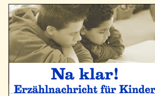
Na klar! Erzählung für Kinder

sie nicht teilte oder wen Mao zum Volksfeind erklärte, wurde getötet oder in sogenannten Umerziehungslagern gequält. Maos chaotische Wirtschaftspolitik löste schwere Hungersnöte aus. Dennoch genießt er als einer der Befreier Chinas von der japanischen Besat-