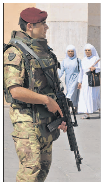
In Rom patrouilliert ein italienischer Soldat vor einer Kathedrale.

3000 Soldaten sollen in italienischen Städten für mehr Sicherheit sorgen und Kriminelle aufspüren